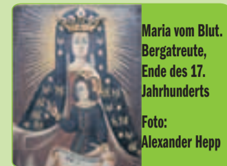
Maria vom Blut. Bergatreute, Ende des 17. Jahrhunderts.

Bad Wörishofen 6. Januar 2011: „2. Bad Wörishofener Krippenweg“. In der Innenstadt. Informationen bei der Kurverwaltung.