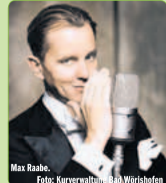
Max Raabe.

Bad Wörishofen Auftritt von Entertainer Max Raabe und seinem Palastorchester. Im Kursaal. Nur noch wenige Restkarten erhältlich. Informationen bei der Kurverwaltung.