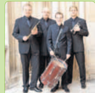
Das Ensemble „Bavaria Brass“ gibt in verkleinerter Besetzung ein weihnachtliches Konzert.

Großes Benefizkonzert mit „Bavaria Brass“. Musik, die besonders den Glanz des Barocks zum Ausdruck bringt. Beginn 16 Uhr in der Evang.-Luth. Kirche. Weihnachtliches Konzert zu Gunsten des Kindergartens Woringen, des Behindertenwohnheim der Lebenshilfe in Eisenburg und dem Kinderhospiz Bad Grönenbach. Eintritt: 15/erm. 10 € für Kurgäste, Schüler und Studenten. VVK und Infos bei Kurverwaltung Bad Grönenbach, Arztpraxis Eduard Zivkovic, Tel. 08334/1233 sowie an der Abendkasse.