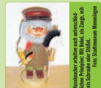
Nussknacker erhalten nach unterschiedlicher Prinzipien: Mit Hebel, als Zang, mittels Schraube oder Stößel.

nach bis Sonntag, 23. Januar 2011: Weihnachtliche Sonderausstellung „Knackis oder Knacker“. Es ist wieder Weihnachtszeit. Da werden die meisten Nüsse geknackt. Grund genug für das Stadtmuseum, eine Ausstellung mit Nussknackern zu präsentieren. Geöffnet: Di. bis So. und Feiertage 10 bis 13 Uhr und 14 bis 17 Uhr. Museum geschlossen am 24./25./26. und 31. Dezember, sowie 01. Januar 2011. Führungen an den Sonntagen, 12. Dezember und 16. Januar 2011, jeweils 14 Uhr. Informationen unter Tel. 08331/850-134.