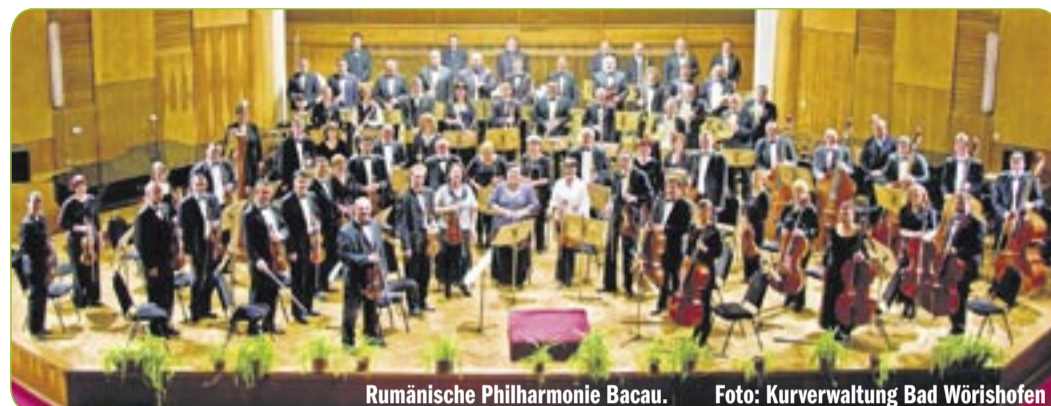
Rumänische Philharmonie Bacau.