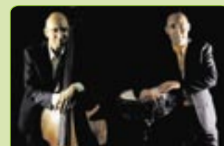
„Die Lieblinge“ eröffnen die Bad Grönenbacher Sommerfrische 2010.

Do., 1. Juli Bad Grönenbach Sommerfrische: Open-Air-Konzert mit der Band „Unsere Lieblinge“ zur Eröffnung. Beginn 20 Uhr auf dem Marktplatz. Bei schlechtem Wetter im Landgasthof zur Post. Eintritt: 18/erm. 16 €. Weitere Informationen siehe Artikel links und bei der Kurverwaltung.