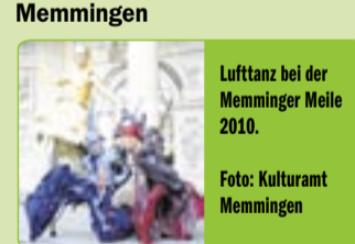
Lufttanz bei der Memminger Meile 2010.

Fr., 9. Juli Bad Grönenbach Schlosskultur: „Dixie, Swing und gute Laune“. Open-Air-Konzert mit den Washhouse Basement-Stompers. Benefizveranstaltung zugunsten des Nothilfe e.V. Beginn 19 Uhr im Schlossgraben. Bei schlechter Witterung im Landgasthof zur Post. Eintritt: 15 €, für Kurgäste 13 €, Schüler/Studenten 10 €. Informationen bei der Kurverwaltung.