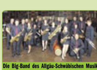
Die Big-Band des Allgäu-Schwäbischen Musikbundes.

Sa., 31. Juli Bad Grönenbach Sommerfrische: Musikalische Reise mit dem Duo Ritmico. Beginn 20 Uhr im Hohen Schloss. Eintritt: 11/erm. 9 €. Informationen siehe links und bei der Kurverwaltung.