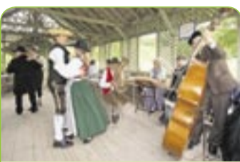
Heiterer Tanz und geselliges Musizieren.

Illerbeuren. Im Bauernhofmuseum treffen sich Volksmusikanten und Liebhaber unverfälschter Traditionsmusik zum gemeinsamen Musizieren. An vielen stimmungsvollen Orten auf dem Museumsgeleände stellen Musikgruppen aus ganz Schwaben die Bandbreite ihrer Instrumente und Melodien vor. Gestandene Kapellen sind genauso gegenwärtig wie fleißige Nachwuchsmusikanten. Die Veranstalter laden zu einem offenen Singen für Besucher ein und bei günstiger Witterung findet im Gelände Volkstanz zum Zuschauen und Mitmachen statt. Anmeldungen werden im Bauernhofmuseum angenommen, auch spontanes Mitmusizieren ist möglich. Informationen unter Tel. 08394/1455.